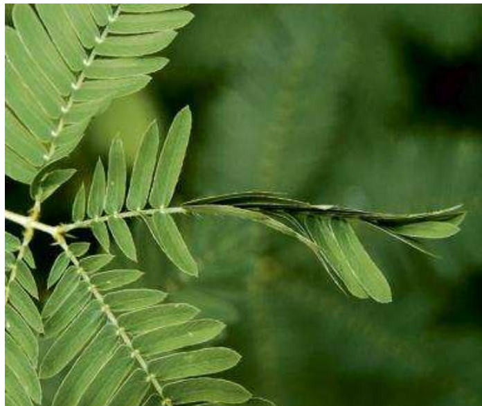
Feuille sensible de «Mimosa pudica» après stimulation.

dans la transmission électrique, mon laboratoire pense que ces deux types de cellules travaillent ensemble pour l'envoi du signal. Mais on ne sait toujours pas qui fait quoi.